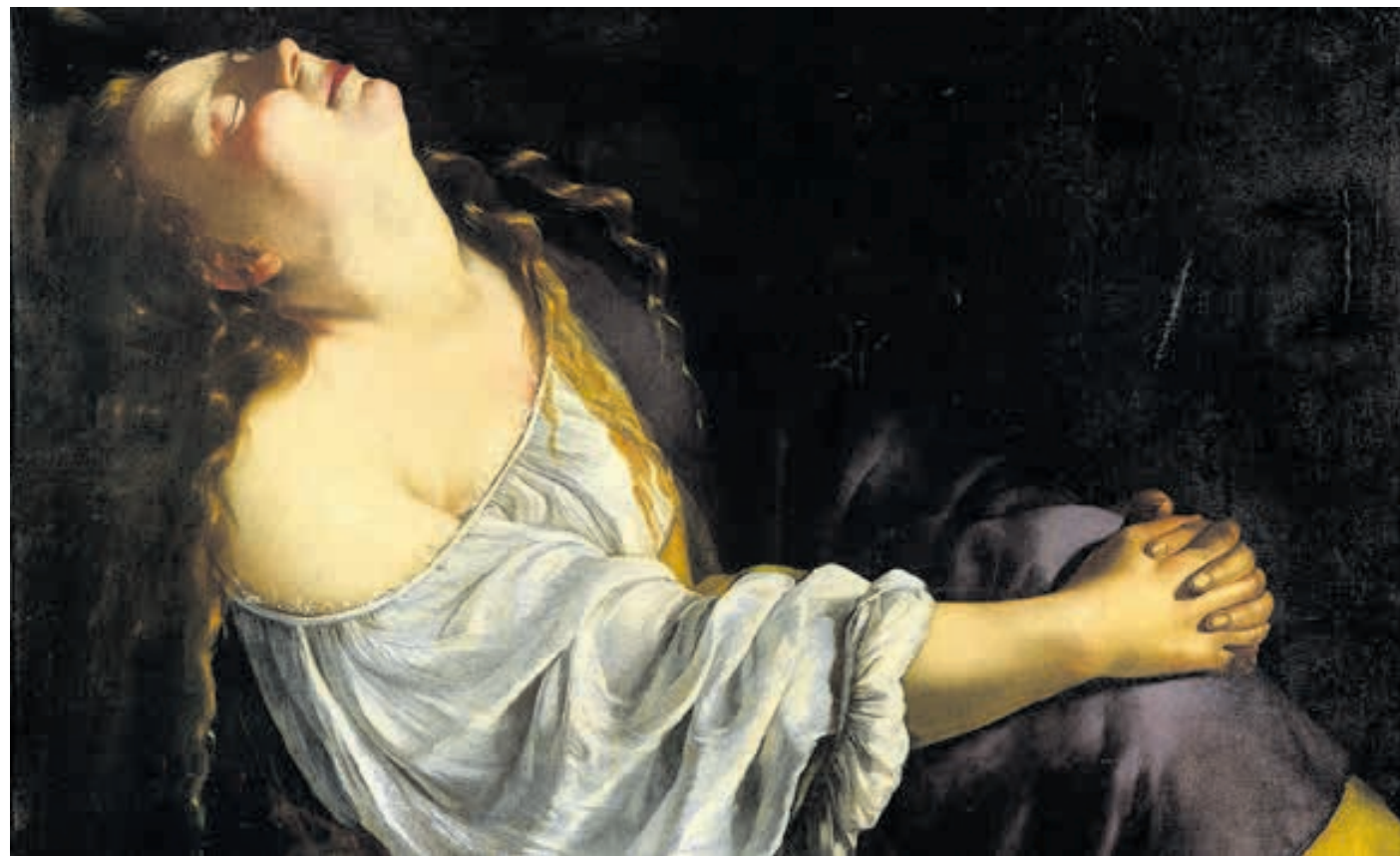
Artemisia Gentileschi, «Maddalena in estasi» (1620 ca.)

Tra antichità e post-modernità, dalle Scritture alla lettura femminista e queer